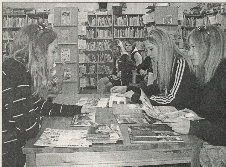
Jeden z pracovních týmů navštívil Městskou knihovnu v Rakovníku.

děvčata bez mrknutí oka. Ještě než přejdu k dalšímu stánku, dostávám na cestu propagační brožurku o hradu a také „zlatou“ čokoládovou minci.